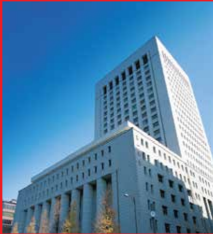
Tòa nhà trụ sở Dai-ichi Life Holdings tại Tokyo, Nhật Bản